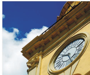
Un particolare della Torre dell'Orologio