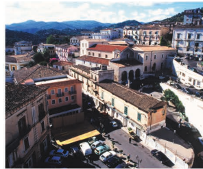
Vista panoramica del centro storico

Rossano offre quindi al visitatore monumenti preziosi come: la cattedrale di Maria Santissima Achirpita, una chiesa famosa ovunque per un'immagine della Madonna non dipinta da mano umana e poi, la chiesa di S. Bernardino e la chiesa della Panaghia, due esempi eccellenti di architettura bizantina.