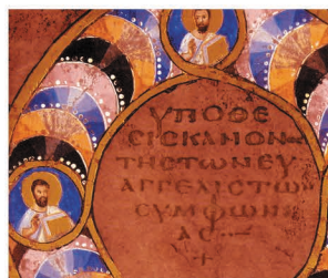
Codex Purpureus - Particolare della Tav. IX