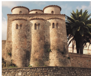
La Basilica di San Marco